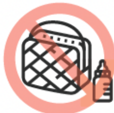
Bolso para pañales