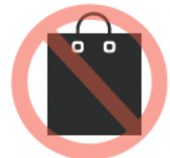
Bolso de mano grande