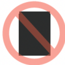
Bolsa a color de almacenamiento y de plástico