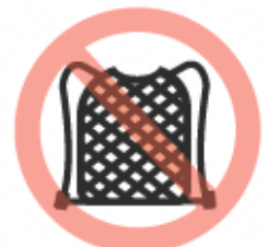
Bolsa de malla o paja