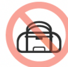
Bolso de viaje