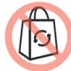
Bolsa de compras reutilizable