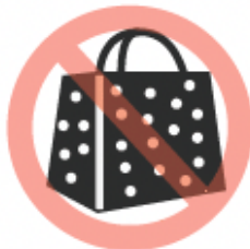
Bolsa de plástico con estampado impreso