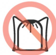
Bolso deportivo de un solo color