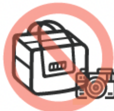
Estuche de cámara